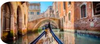
PASEO EN GÓNDOLA EN VENECIA