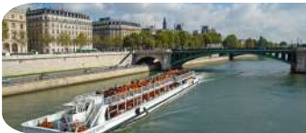
PASEO EN BARTEAUX MOUCHE