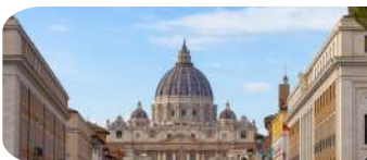
VATICANO: MUSEOS Y CAPILLA SIXTINA