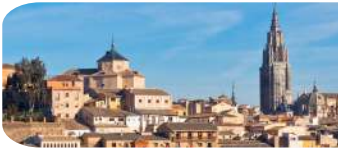
VISITA A TOLEDO