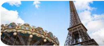
SUBIDA A LA TORRE EIFFEL (2º PISO)